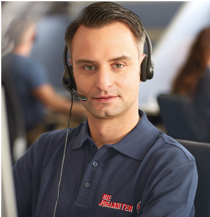
Sie helfen, wenn es wirklich wichtig ist: Die Johanniter-Unfall-Hilfe...