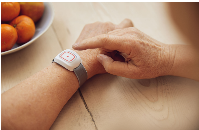
... und der Johanniter Hausnotruf.